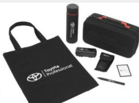
Zestaw prezentowy Professional Gadżety