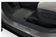
Dywaniki gumowe Dywaniki / Wykładziny

Toyota bZ4X - Elektryczny JTMAABAA90A042312