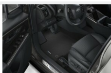
Dywaniki welurowe Dywaniki / Wykładziny