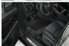
Dywaniki welurowe - premium Dywaniki / Wykładziny