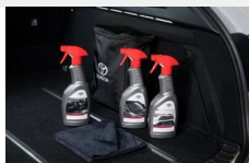
Zestaw kosmetyków samochodowych Toyoty Kosmetyki